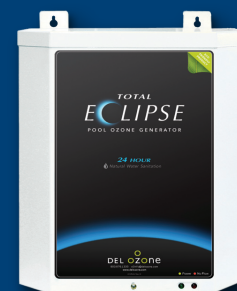
Total Eclipse 2 & 4™