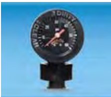
Manómetro con indicador Limpio/Sucio