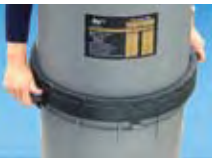
Innovador cinturón de cierre

innovador de cinturón de cierre, diseño atractivo, delgado, material duradero de alto impacto y carcasa de termoplástico resistente a rayos UV. Disponible en modelos de 200 y 250 pies cuadrados.