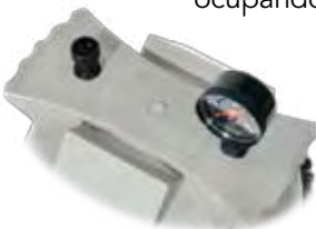
Tapas con manijas ergonómicas

El filtro CS es compacto y tiene manijas ergonómicas, desagüe sobredimensionado y uniones universales. Se encuentra disponible en modelos de 100 y 150 pies cuadrados.